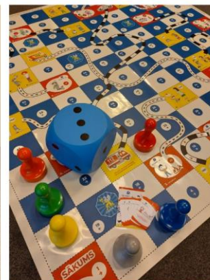
LIELFORMĀTA SPĒLE "KO DARĪT, JA..." 250X250M

Lejupielādējama spēle un spēles instrukcija ar iespēju to izprintēt pieejama GRIFS AG mājaslapas sadaļas “Sociālā atbildība” apakšsadaļā “Bērnu drošība”