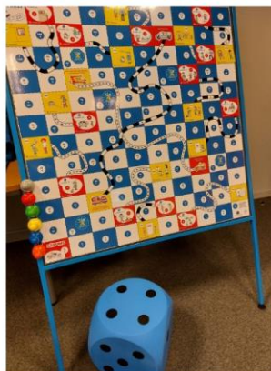
MAGNĒTISKĀ SPĒLE "KO DARĪT, JA..." 100X100M (AUGSTUMS 150M)

2023.gadā ar programmas “Ģimenei draudzīga darbavieta” grantu konkursā iegūtu finansējumu, GRIFS AG izgatavoja divu formātu spēli “Ko darīt, ja ...” par drošības jautājumiem. Tā ir pieejama GRIFS AG darbiniekiem, uzņēmumiem, mācību iestādēm u.c., lai to varat spēlēt arī savos pasākumos vai mācību stundās.